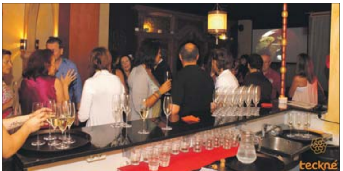
Una imatge de la inauguració.