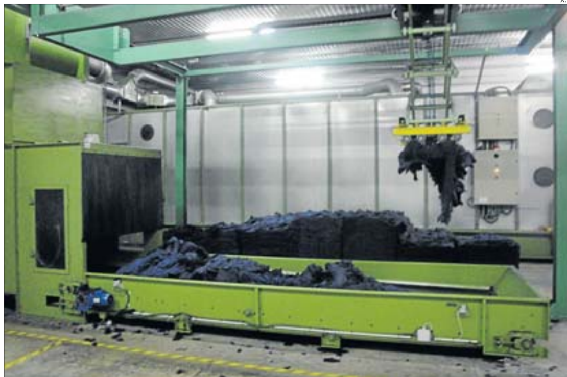
El procés de la producció del fil comença amb el trinxat dels draps, cosa que suposa el reciclatge de teixits.

producció en compromís amb el medi ambient. «Havíem de treure alguns productes nous que ens servissin per donar línia de negoci i que alhora fossin sostenibles», explica el gerent, Eudald Teixidor, respecte als fils de soja i de bambú.