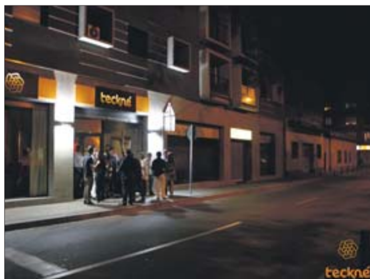
Vista exterior del nou local.

► Gran èxit en la nova obertura d'un nou espai Restaurant-Copes-Lounge situat a la zona de la Devesa