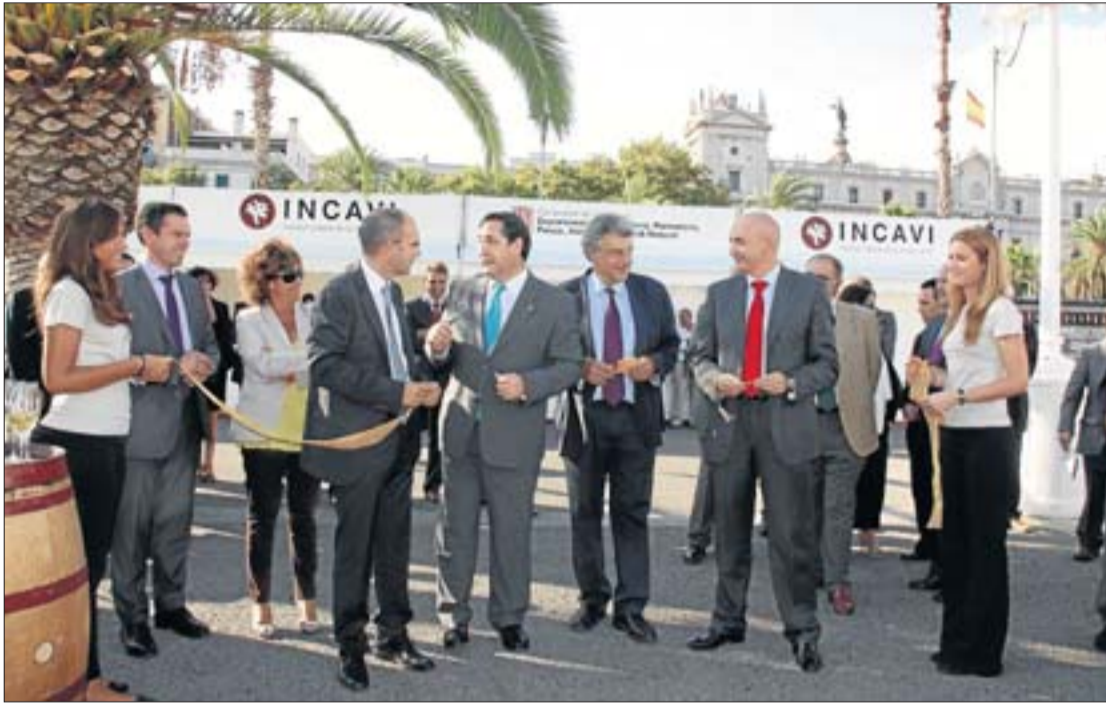
Un moment de la inauguració de la mostra, ahir a la tarda.

El conseller va destacar que la reducció del cost dels expositors, que aquest any s'ha rebaixat un